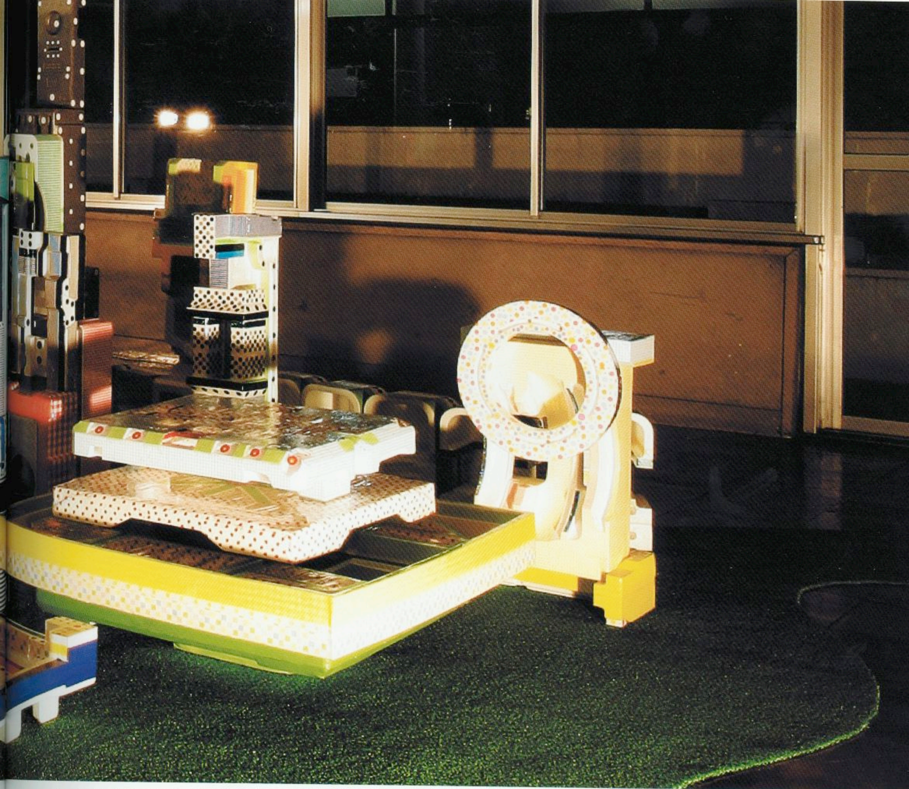
〈サイドウォークカフェから星まで〉(発砲スチロール、テープ、サイズ可変) From Sidewalk Cafes To The Stars (Styrofoam, tape, size variable)